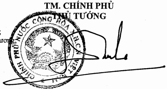
Nguyễn Tấn Dũng